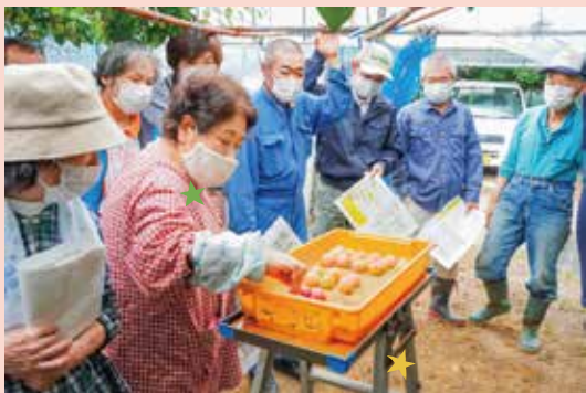
目均し基準を確認する生産者