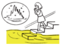
地下に水が流れ浸水の危険性