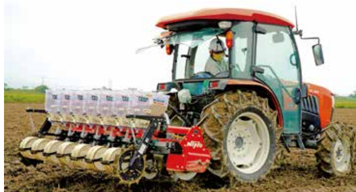
多収米「やまだわら」の種子をまく直まき機