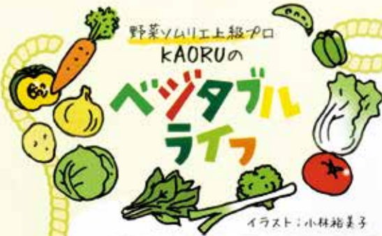
イラスト：小林祐美子