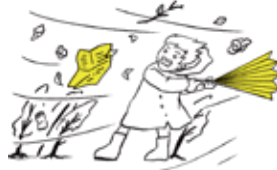
暴風時の屋外は飛散物が非常に危険です。無理な外出はしないでください。