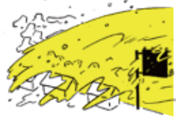
台風接近時は高潮・高波が危険です。なるべく高く安全な場所に避難を。