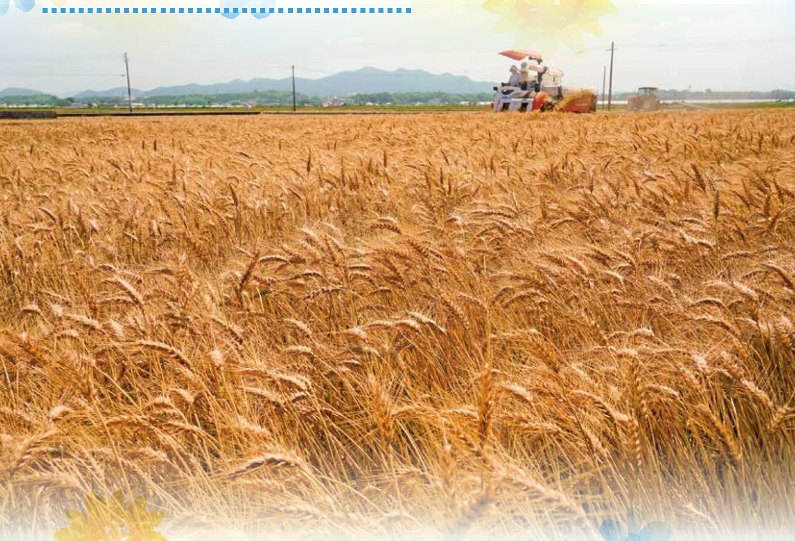
小麦「ミナミノカオリ」の収穫

■ お知らせ 7月のJAの日は 7月21日 (水) です ※JAカレンダーの記載とは異なります