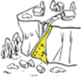
土砂災害の危険性