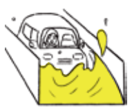
車が浸かると身動きが取れなくなる危険性