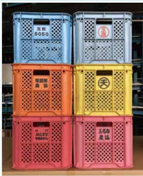
写真:JAたまな柑橘部会コンテナ例

みかんを集出荷する際に、コンテナは必要不可欠な資材です。柑橘部会員様に限らず、各ご家庭で所持されている部会コンテナの回収を行います。大変お手数をお掛けいたしますが、下記の最寄り施設へ搬入していただきますよう何卒よろしくお願い致します。