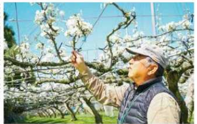
一つ一つ手作業で花粉をつける尾上部会長

梨の花は、収穫が遅い品種から先に花が咲きます。実になると摘果作業をし、質の良い果実に育てていきます。早生の「幸水」は8月上旬頃から出荷が始まり、管内の主要品種「豊水」「新高」などと共にリレー出荷が続きます。