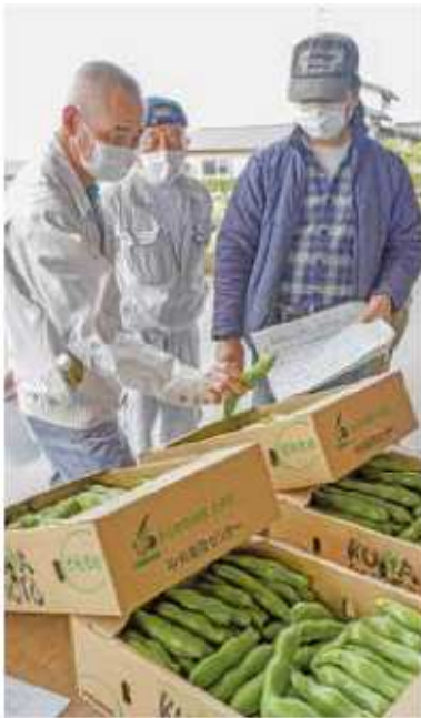
収穫規格を確認する部会員