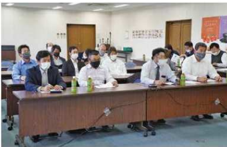
市場関係者と協議するトマト部会役員とJA役職員

今後は気温上昇による病害虫や黄変果の発生に注意し、部会員一丸となり高品質のトマト生産に努めていきます。