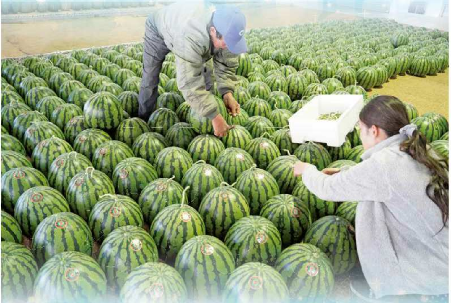
出荷前にスイカのつるを取る生産者