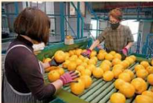
河内晩柑を一つ一つ確認する従業員

JAたまな管内で「河内晩柑」の出荷が始まりました。令和3年産も品質良好で4月下旬まで出荷が行われました。