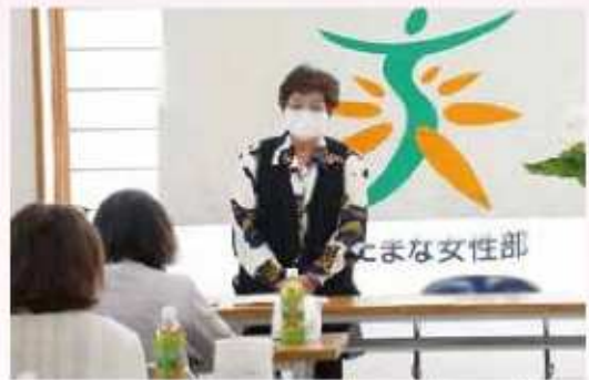
挨拶をする岩見部長