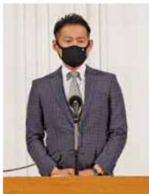
挨拶をする坂上部長