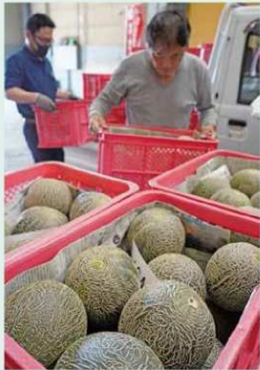
肥後グリーンメロンを持ち込む生産者