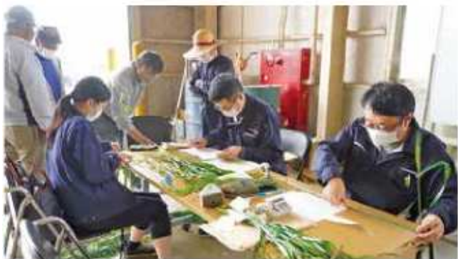
追肥量診断を行う検査員

3月30日には、生産者が圃場ごとに刈り取ったミナミノカオリの葉を調査しました。「Premium T」となる高タンパク小麦の収量増加を目指し、JAは行政と協力して追肥量診断を行っています。葉の長さやSPAD値(葉色)を調べ、穂揃い期の適正な追肥量を生産者に伝えます。