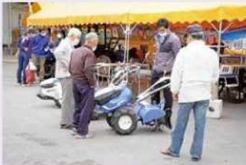
農機具の説明を受ける来場者

展示会には各メーカーのトラクターや管理機などの農機具や自動車展览展示されたほか、Aコープ商品や生活用品、苗なども販売しました。