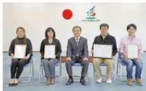
浦津組合長(中央)と受賞者