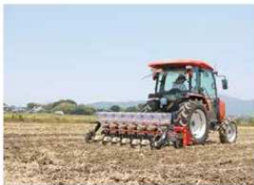
畝を立てながら種子を播く直播き機