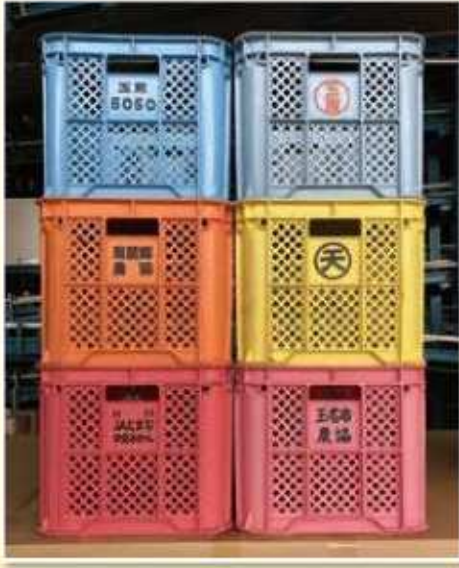
写真-JAたまな柑橘部会コンテナ例

みかんを集出荷する際に、コンテナは必要不可欠な資材です。柑橘部会員様に限らず、各ご家庭で所持されている部会コンテナの回収を行います。大変お手数をお掛けいたしますが、下記の最寄り施設へ搬入していただきますよう何卒よろしくお願い致します。