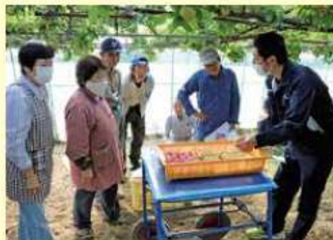
着色基準を確認する生産者

ハニーローザは、糖度が高く酸味が少ないスモモの一種で旬が10日ほどと非常に短いため「幻のスモモ」と呼ばれています。