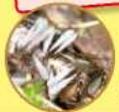
シロアリの羽アリ

無料で床下点検・点検結果の報告を行い、お客様にあった防除をお勧めします。その後、お客様から申し込みがあった場合に、JA取扱業者が防除を行います。